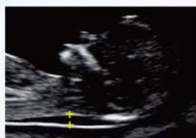
胎兒頸部透明帶 超音波檢查