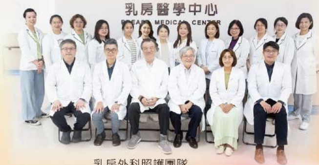
乳房外科照護團隊