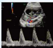
孕婦子宮動脈血流 超音波檢查