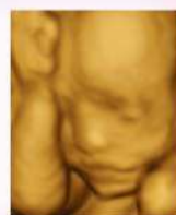
高層次立體 超音波檢查

※婦產部衛教室 復健醫療大樓1樓 ※諮詢專線：04-22052121分機12188