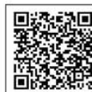
衛教講座活動 報名網站QR CODE