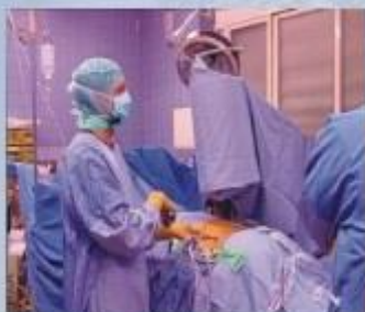
病患臥臥在手術台，以X光機定位