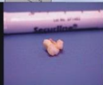
夾出突出的髓核組織，手術完成