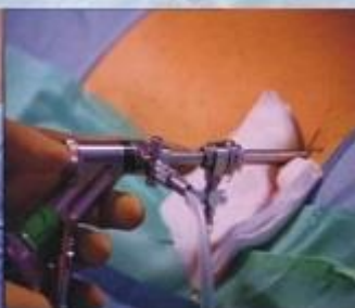
透過工作套管操作器械